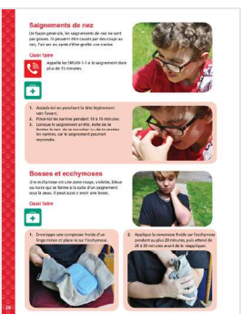
Exemples de pages