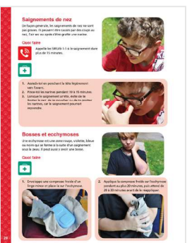
Exemples de pages